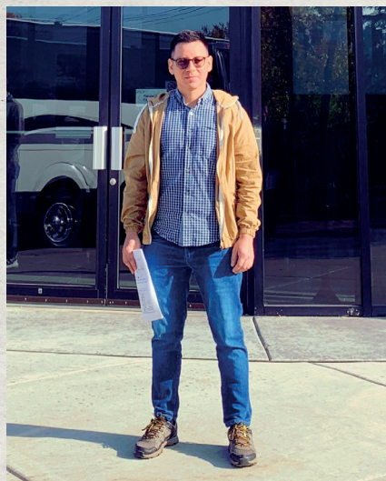
Saint Paul, Minnesota, Estados Unidos. 23 de octubre de 2023. Participación en el Swine Education & Outreach Professionals Conference.