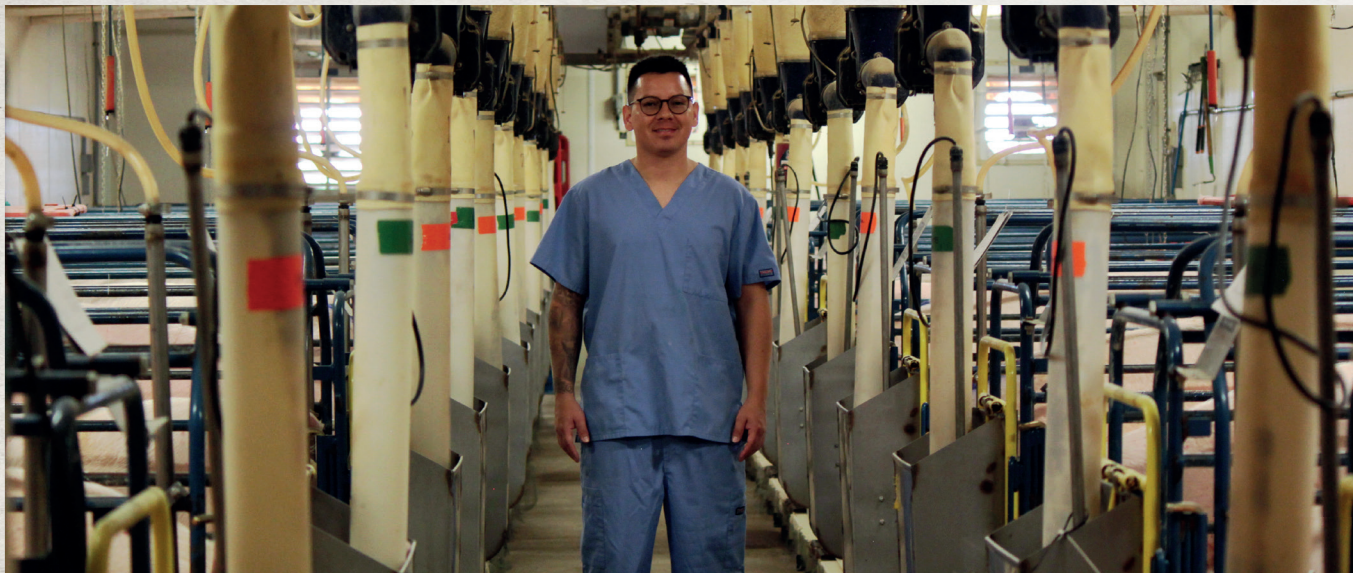
Brookings, South Dakota, Estados Unidos. 14 de julio de 2025. Investigación en nutrición porcina en la granja experimental de South Dakota State.