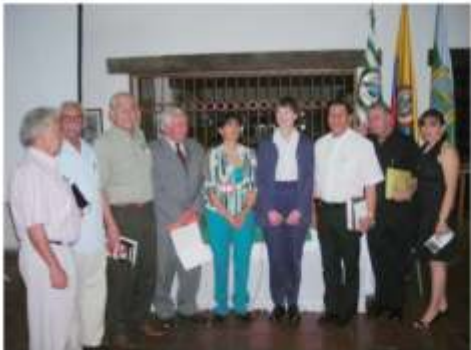
Curso Taller "Metodología de la Investigación en Historia", Villavicencio julio 15, 16, 17, 22, 23, 24 de 2009, el cual nos compromete a ofrecer un programa académico en Historia de los Llanos, cuidar los archivos históricos y apropiación de la historia llanera en el "mapa mental" de población.