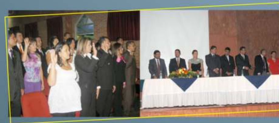
Grados de la Facultad de Ciencias Económicas. Izquierda graduando, derecha mesa directiva. Sede San Antonio, 10 de julio de 2009.