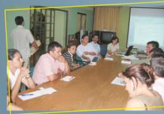
Reunión de trabajo con representantes de las Asociaciones de Egresados.

Presente su carnet de egresado y obtenga descuento en todos los programas