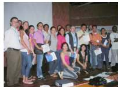
Seminario-taller de formulación-priorización de proyectos con enfoque de marco lógico y gestión de cooperación internacional, en el marco de demandas sectoriales de cooperación (septiembre - diciembre de 2009).