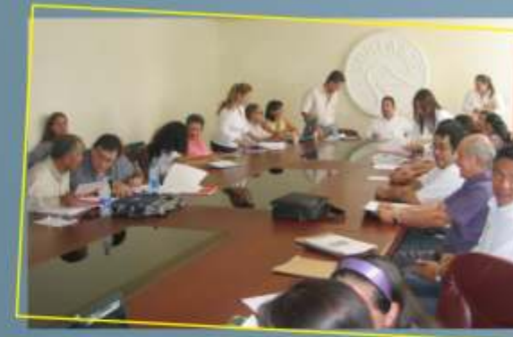
Visita de evaluación externa al programa de Lic. en Educación Física y Deportes. Junio 18 al 20 de 2009.