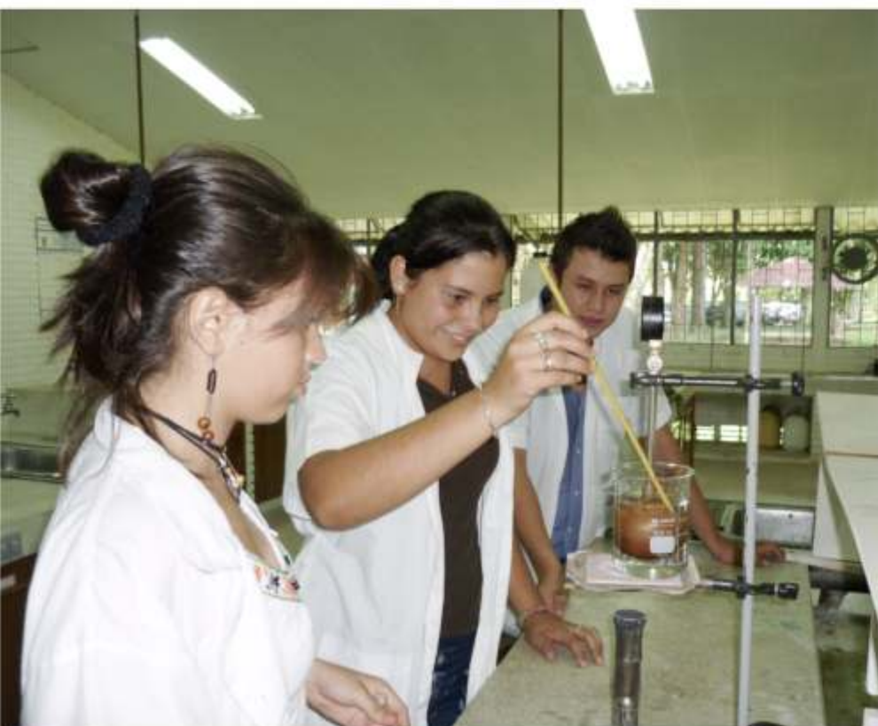
Universidad de los Llanos. Villavicencio, octubre de 2009

La competitividad, que debe ser considerada por todas las organizaciones, no solamente desde el punto de vista de más equipos, infraestructura o tecnología, también debe enfocarse en el talento humano y su capacidad para poder usar todos estos avances en aras de mayor rendimiento, optimizar recursos y ser más competitivo y rentable. Es aquí donde está la oportunidad de sostenerse en el entorno.