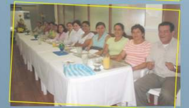
IV Encuentro de Egresados del Programa de Enfermería. Villavicencio mayo 9 de 2008.