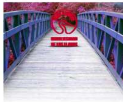
Universidad de los Llanos. Villavicencio, octubre de 2009

De igual manera, entre otros logros que se han alcanzado, se encuentra la